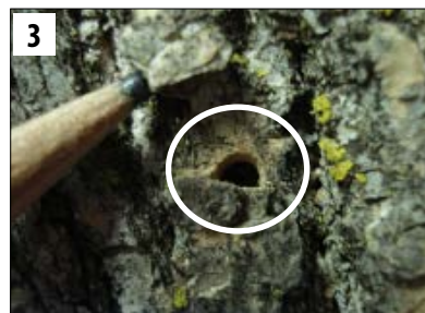
(1) Adult EAB, and actual size in top right corner; (2) EAB larva, and actual size in bottom left corner; (3) D-shaped exit hole (1) EAB adulto, y uno de tamaño real en la esquina derecha superior; (2) Una larva de EAB, y una larva de tamaño real en la esquina inferior izquierda; (3) Orificio de salida en forma de "D"

El Barrenador verde Esmeralda del Fresno (EAB) es una especie invasora de Asia. Fue descubierto por primera vez en los Estados Unidos en el 2002. Actualmente se ha propagado en los estados del este de EUA y hasta Colorado en el oeste matando cientos de millones de fresnos. El EAB se propaga principalmente cuando es transportado en plántulas de vivero y leña. Aún no se ha encontrado en Oregon, pero todos los fresnos en las ciudades y bosques están en alto riesgo. Una vez que el EAB se establece, es muy difícil de controlar. Si está atento y al cuidado del EAB, usted nos puede ayudar a proteger los árboles y bosques en Oregon.