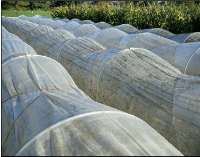
Túneles bajos con cubierta de plástico de invernadero. Los lados pueden subirse para ventilar

permanecer en el sitio indefinidamente, y es mucho más rentable que un invernadero porque los costos de los materiales de construcción y fuerza laboral son menores.