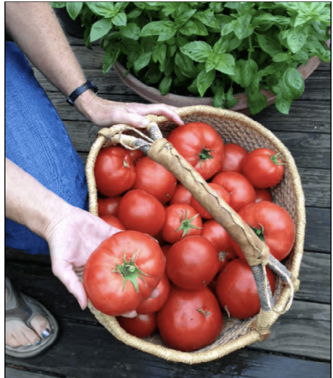
La cosecha de tomates.

Los tomates y productos de tomate también pueden ser congelados o deshidratados.