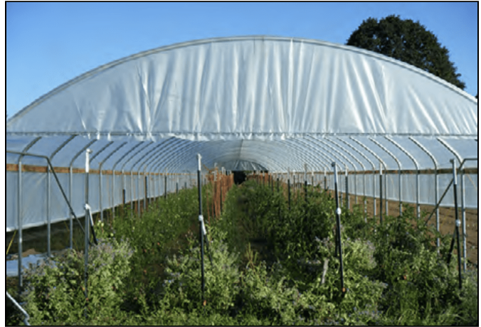
Producción de tomate en túnel alto usando un sistema de guías para sostén.

Coloque el anillo o tipi alrededor de la planta a principios de la temporada para darle una protección adicional, y luego retírelo cuando la planta está más grande y el clima se vuelve consistentemente más cálido. En ambientes de cultivo severos, los jardineros dejan el anillo de agua o tipi en la planta durante toda la temporada.