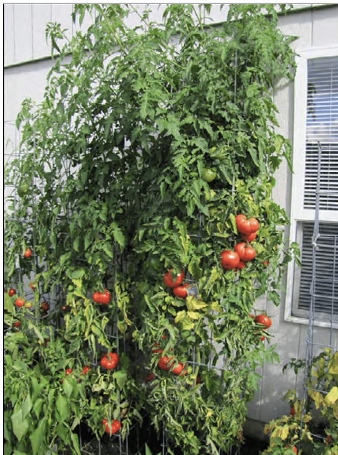
Tomate indeterminado enrejado y podado.

En el sentido estricto, las plantas indeterminadas no requieren que se poden más que los tipos determinados. Pero, para la corta temporada de cultivo de Oregon, la eliminación de los brotes laterales (también conocidos como “chupones”) en las axilas de las hojas resultará en un fruto más grande y—lo que es más importante—una