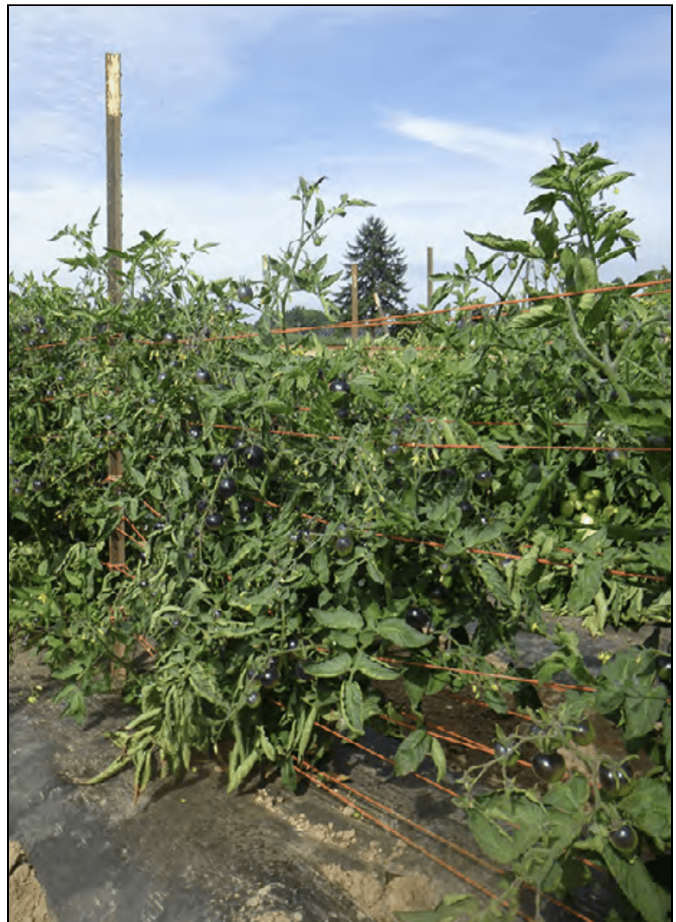
Sistema de red entretejida en tomate ‘Indigo Rose.’