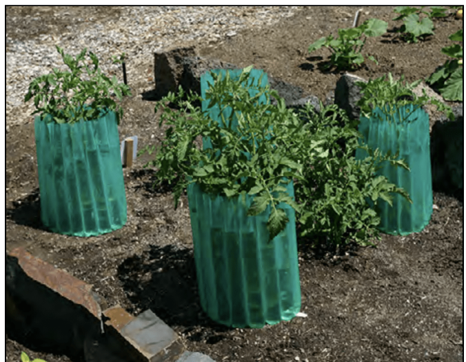
Anillos de agua.