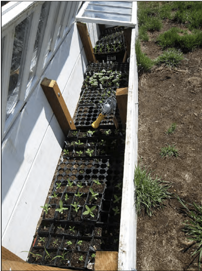
Propagación de plantas en estructura fría.

* Partenocárpico (sin semillas) tipo desarrollado por Oregon State University