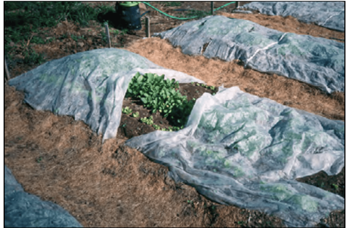
Cubrehileras en camas elevadas.

Una “carpa” de plástico de polietileno transparente funciona bien. Aros de alambre calibre # 9, de 5 pies de largo, formados en arcos, funcionan bien como soportes para las cubiertas de plástico. Coloque una hoja de plástico en cada lado, dejando una pequeña abertura en la parte superior para la ventilación. Use pinzas de resorte para afianzar el plástico a los arcos y mantener cerrados los extremos de la tienda.