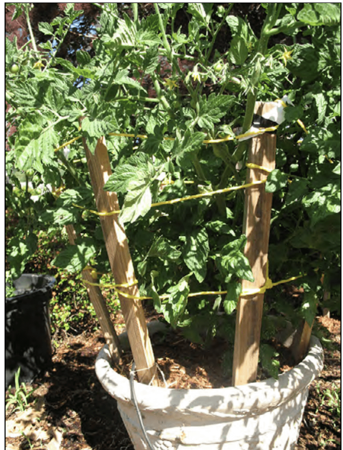
Estacas para tomate que crece en maceta.

Las plantas de tomate que se iniciaron en el interior o en invernadero deben ser aclimatadas antes de plantarlas en el huerto. Esto puede hacerse de forma gradual durante unos días, aumentando su exposición a temperaturas más bajas, a la humedad más baja, y a la luz más brillante. La exposición puede comenzar con sólo unas pocas horas, incrementando el tiempo cada día, hasta que estén listas para ser plantadas.