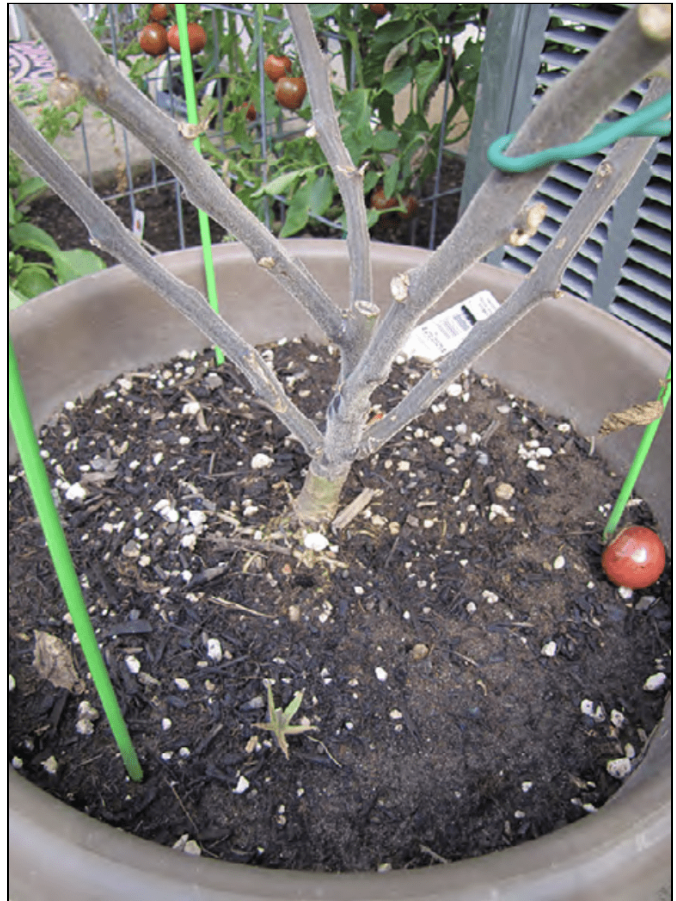
Planta injertada y podada, creciendo en maceta.