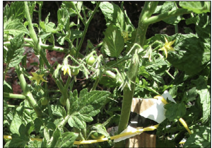
Racimo floral de tomate con fruto joven.

Los tomates determinados tienen varios tallos principales que producen libremente brotes laterales. Los brotes y ramas principales crecen vigorosamente y luego producen racimos de flores en las puntas que detienen el crecimiento del tallo y permiten que la planta comience la maduración del fruto. Como resultado, las plantas determinadas tienden a madurar sus frutos en un período corto, por lo general sólo un par de semanas.